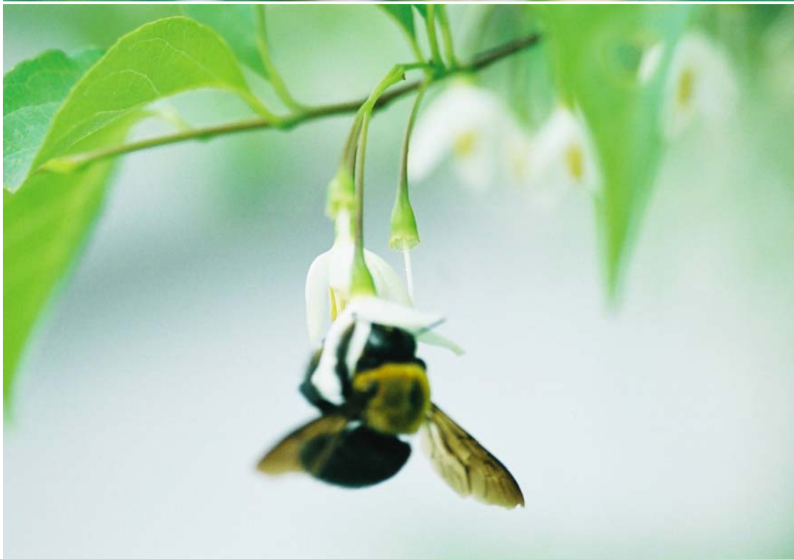
上は白い花に吸蜜に来たクロアゲハ(日光市)。下はエゴの花にやって来たクマンバチ(都内港区)。